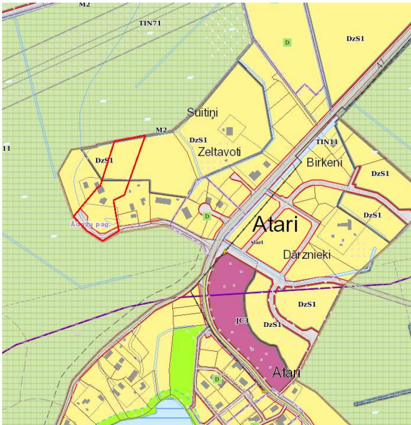
Attēls 3 – zemesgabala novietojums TIAN