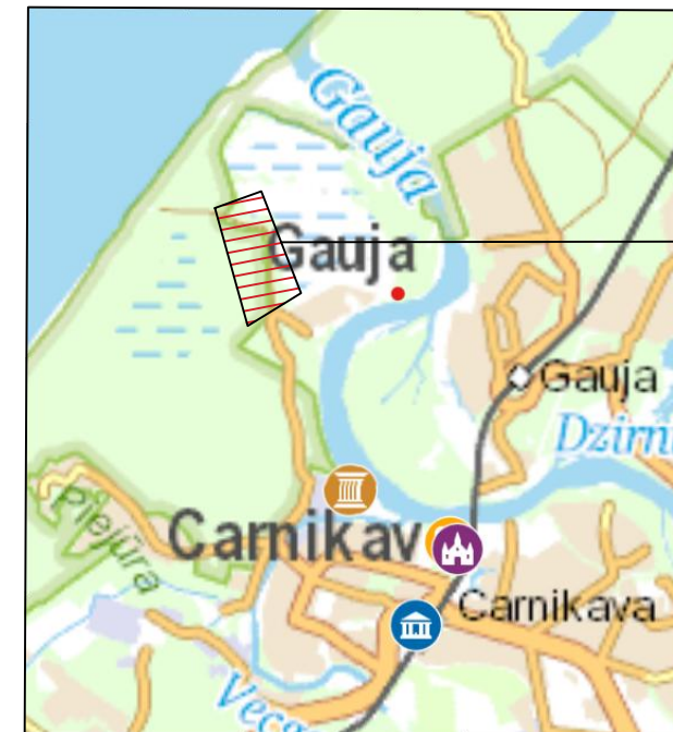
Objekta atrašanās vieta

Garennorobežojums - divpusīgie vadstatņi Nr. 908/909 maks. 20m attālumā cits no cita. Ieteicama divpusīga signāluguns uz katra otrā vadstatņa.