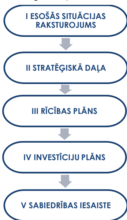
2.attēls. Attīstības programmas sastāvs

Īstenošanas uzraudzības un novērtēšanas kārtība, kas arī ir viena no Attīstības programmas sastāvdaļām ir iekļauta otrajā sējumā Stratēģiskā daļā, kurā noteikts uzraudzības process.