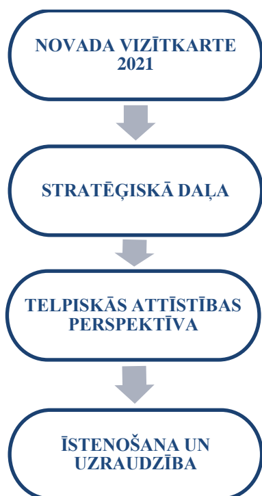
1.attēls. Ilgtspējīgas attīstības stratēģijas sastāvs