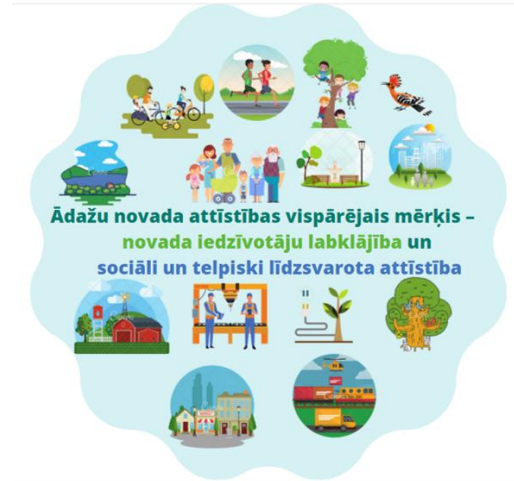
Attēls 3 Novada vispārīgais mērķis

Ādažu novada attīstības vispārējais mērķis – novada iedzīvotāju labklājība – veselīga, labvēlīga un droša vide dzīvošanai, izglītībai, atpūtai un sevis apliecināšanai, kā arī sociāli un telpiski līdzsvarota attīstība , kas virzīta uz daudzveidīgu, uz kultūru un zināšanām balstītu konkurētspējīgu saimniecisko darbību.