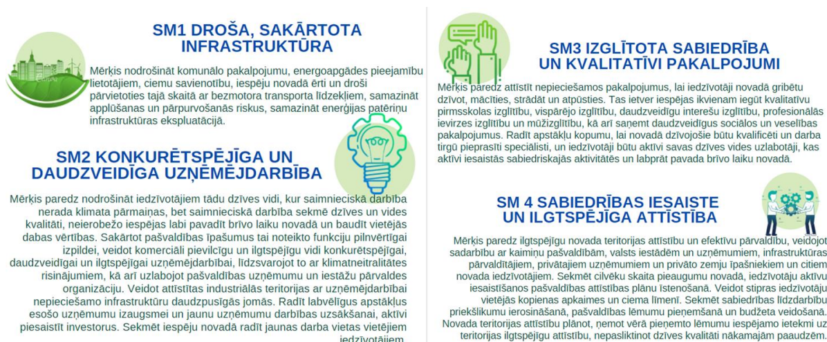
Attēls 5 Ādažu novada stratēģiskie attīstības virzieni

Ādažu novada attīstība balstās uz 4 stratēģiskiem attīstības virzieniem .