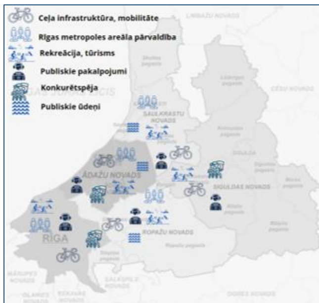
Attēls 9 Kopīgās intereses ar kaimiņu pašvaldībām