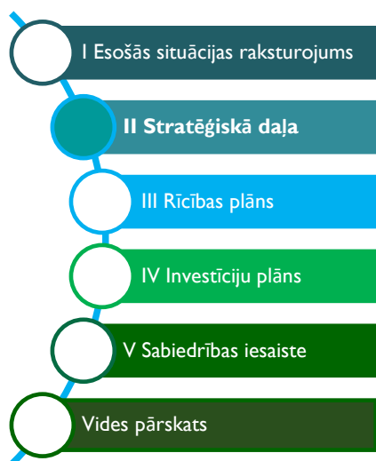
Attēls 1 Attīstības programmas sastāvdaļas