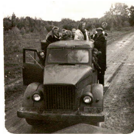
Ekskursija slimnīcas darbiniekiem. 50. gadu beigās.

1960. gadā Ādažu slimnīcas pavēļu grāmatā tika izdarīti divi vēsturiski svarīgi ieraksti – pirmkārt, aprīlī pēc Rīgas rajona Veselības aizsardzības nodaļas