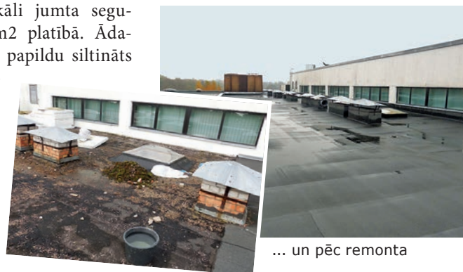
Skolas jumts pirms...

bērnudārzā veikti lokāli jumta seguma remontdarbi 269m 2 platībā. Ādažu vidusskolā – jumts papildu siltināts un ieklāts jauns jumta segums (1940m 2 ). Ādažu Sporta centrā veikta pilnīga vecā jumta seguma un siltinājuma demontāža un jauna jumta siltinājuma un seguma ieklāšana 123m 2 platībā.