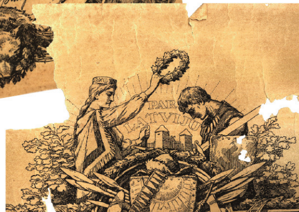
Lāčplēša Kara ordeņa kavaliera diploma fragments. Zīmējuma autors - mākslinieks Rihards Zariņš. No Ādažu Vēstures un mākslas muzeja kolekcijas.

Lāčplēša Kara ordeni piešķīra vienīgi par kara nopelniem un tikai tiem, kuri pašai aizliedzīgi briesmās un grūtībās dodoties, izdarīja savrupu un izcilu varoņdarbu, izpildot savu pienākumu pret valsti. Šo augsto militāro apbalvojumu Brīvības cīņās godam nopelnīja 12 ādažnieki. Diemžēl ļoti atšķirīgus – vieglā-