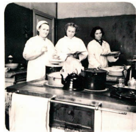
Slimnīcas virtuvē. 60. gadi

“45 gadi Ādažu slimnīcā aizskrēja kā mirklis. Palicis gandarījums par padarīto, ka esmu arī kādu mazu daļiņu no sevis atstājusī Ādažos,” mazliet klusināti nosaka sirmā ārste. Bet dakteres dzīvesbiedrs neļauj mums ieslīgt nostaļģijā par pagājušajiem gadiem, viņš tuvojas mūsu