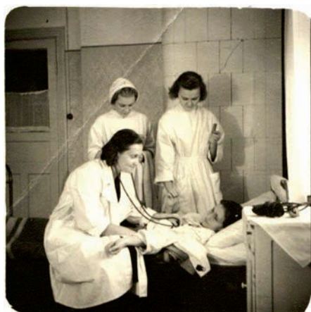
Pie pacienta. 60. gadi

Stāsta daktere A.Zara: “Pacientu slimnīcā pa šiem gadiem bijis liels skaits. Uz Ādažiem ārstēties brauca no visa Rīgas