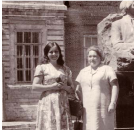
Ar mīlo māsu Genuti jaunībā

centrā. Pateicoties tai, biju kārtīgi sagatavota augstskolai. Vienā no pēdējiem kursiem mēs ar kursabiedriem devāmies ekskursijā, pārgājienā, līdz kādā brīdī, sadalījušies vairākās grupās, pazaudējām