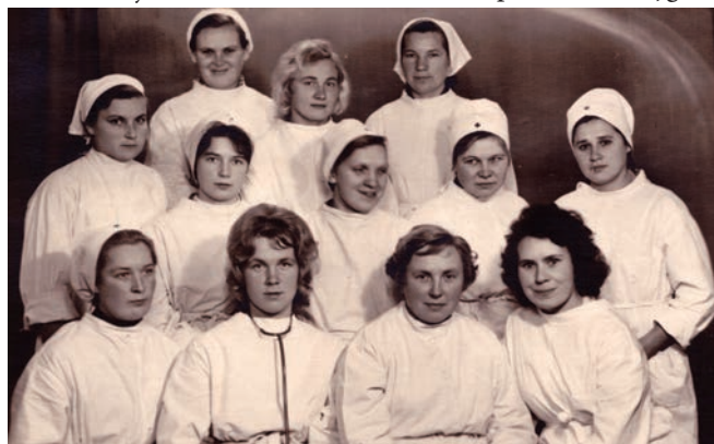
Daktere Deifta jaunībā Māsu skolā. Pirmajā rindā no labās.

Pat pēc 52 darba gadiem ārsta praksē viņa atceras katra bērna dzimumzīmi. "Vienmēr, vienmēr prasū, lai eņģeļi-