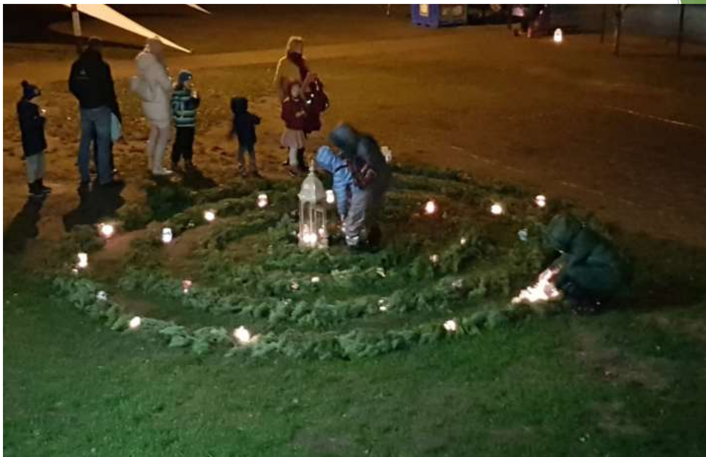
Mūsu tradīcija - Adventes dārzs