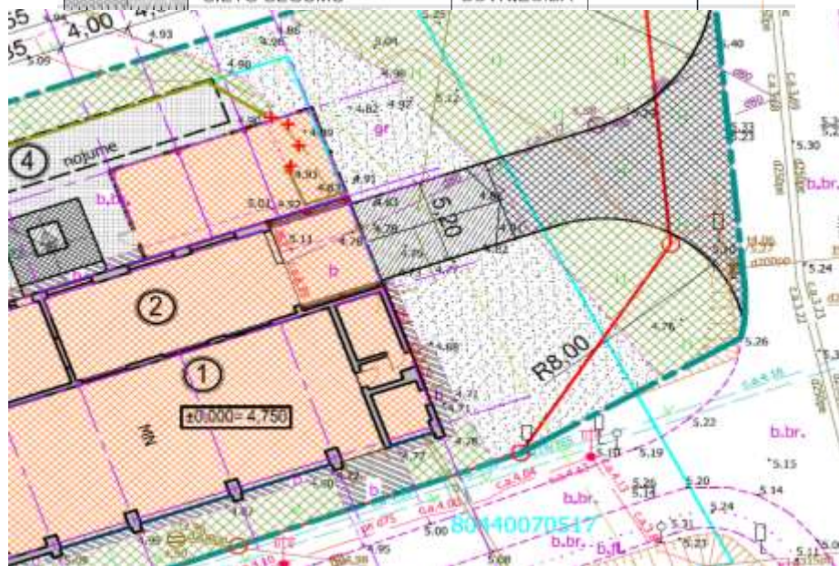
Attēls 2. Projekta “Katlu mājas pārbūve pārejai uz biomasas kurināmo” ģenerālā plāna fragments ar izbūvējama ceļa posmu uz zemes gabaliem Attekas iela 43 un 45, Ādaži.