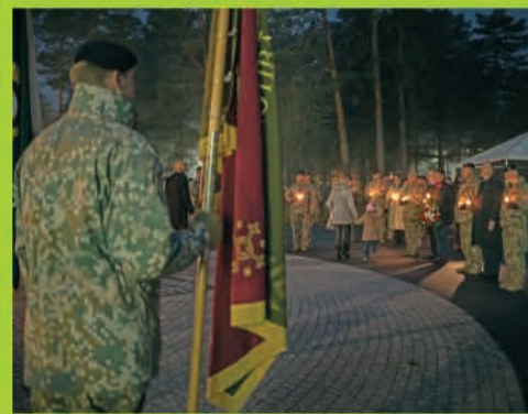
▲ 9. novembrī Ādažu bāzē notika piemiņas pasākums, lai godinātu Latvijas karavīrus, kuri, pildot kaujas uzdevumus, ziedojuši savas dzīvības.