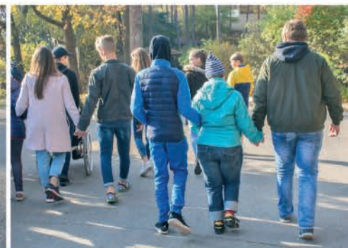
◀▶ Ādažu vsk. skolēni Labo darbu nedēļā pavada "Rūpju bērna" cilvēkus pastaigā pa Rīgas zoodārzu, dāvājot savu laiku, smaidu un palīdzīgu roku.