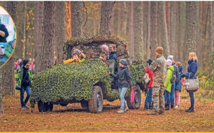
▲ Skolēni no visas Latvijas viesojas Skolēnu dienā Ādažu garnizonā, lai iepazītos ar Nacionālo bruņoto spēku ikdienu un galvenajiem uzdevumiem.