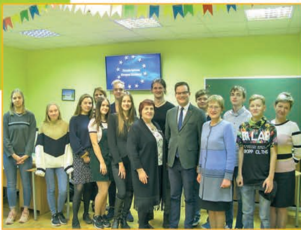
▲ Ādažu vidusskolas Eiropas klubs "Mazie eiropieši" svin 16. jubileju.