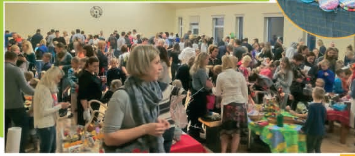
▲▶ Mārtiņdienas tirdziņš Ādažu Kultūras centrā un Ādažu bērnudārzā rit pilnā sparā!