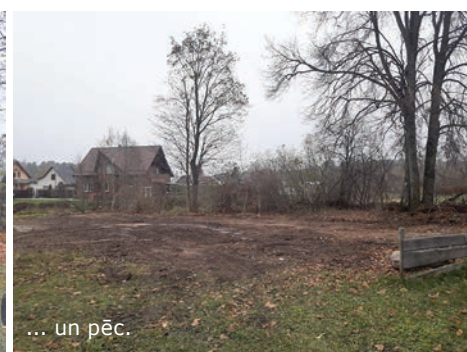
... un pēc.