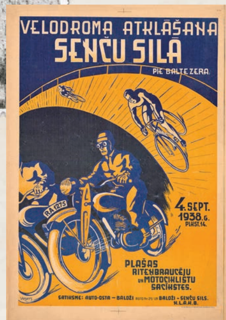
Plakāts velodroma atklāšanai Senču silā pie Baltezera 1938. gada 4. septembrī.