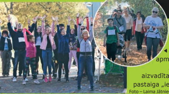
▶▶ Ar krāšņu un vērienīgu uzdevumu, kas sajūsminājis daudzus, Ādažu pirmskolas izglītības iestāde atzīmējusi savu 35. jubileju!