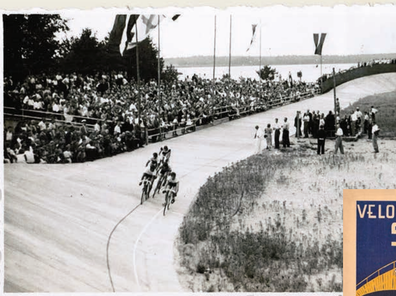
Velotreka sacensības Senču Silā, Baltezerā, 1939. gads

1937. gada vasarā Ādažu pagastā, Lielā Baltezera krastā, tika uzsākta kāda vērienīga sporta būve – riteņbraukšanas un motosporta treks (noslēgts ovāls celiņš ar slīpu pamatu). 1934. gadā ap 4ha lielo zemes gabalu Baltezera krastā iepretim Mīlestības saliņai iegādājās Latvijas Nacionālo karavīru biedrība ( Nacionālā Latvijas atvaļināto karavīru biedrība tika dibināta 1923. gada 1. jūlijā,