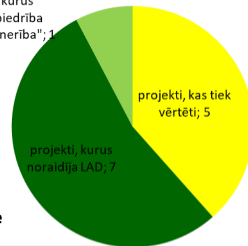
Publiskā finansējuma apguve

projekti, kurus noraidīja biedrība "Gaujas Partnerība"; 1