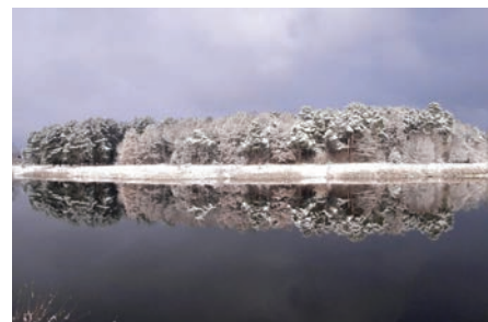
1. vietas ieguvēja – fotogrāfija "Ziema. Atspulgs"