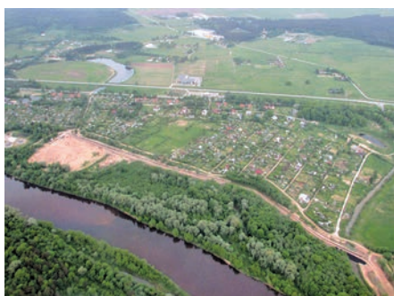
Esošā dambja gar Gauju atjaunotais posms.

Gatavojoties iesniegt projekta "Novērst plūdu un krasta erozijas apdraudējumus Ādažu novadā" 1. kārtas pieteikumu, Ādažu novada dome noslēgusi līgumu ar VSIA "Meliorprojekts" par būvprojektu izstrādi pretplūdu pasākumu īstenošanai. Plānots realizēt aktivitātes abos Gaujas upes krastos. Kreisajā krastā plānota esošā Ādažu Centra poldera aizsargdambja atjaunošana posmā no valsts autoceļa A1 1,5 km garumā, sūkņu stacijas pārbūve un krastu no-