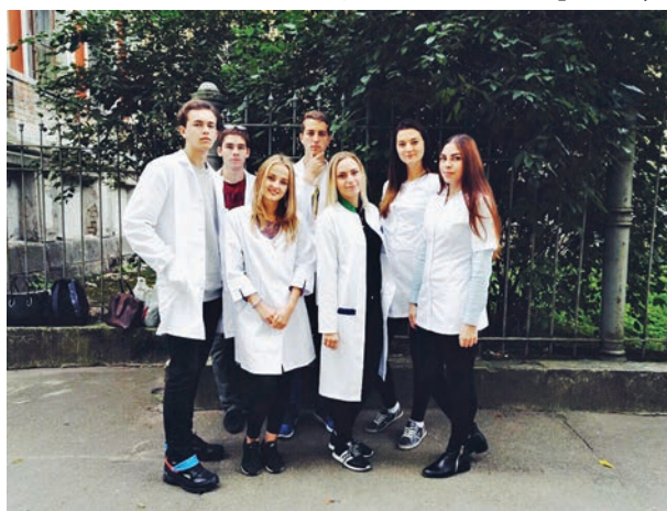
Ar kursabiedriem pie anatomika pirmā kursa sākumā.