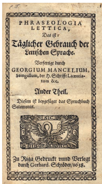
G.Manceļa vārdnīca Lettus.

Par vietvārda Ādaži izcelsmi pastāv divas versijas. Pirmā, ka Ādažiem vietvārdu devusi Latvijas krāšņākā upe Gauja, kuras senais vāciskais nosaukums bijis Aa , reti sastopams bijis arī – Ada Flusing . Iespējams, ka Ada ticis savienots ar Vidzemes lībiešiem raksturīgo galotni “ āži ”. Vietvārdi ar izskaņām – āži , – uži , – iži 14 tiek uzskatīti par somugru cilmes vārdiem, un, kā uzlūko latviešu valodnieks J. Endzelīns, tā ir viena no lībiešu valodas locījuma formām. Līdzīgi skan arī virkne somugru ciemu – Honkasi , Villasi , Horvosi , Papusi , Kannisi , Salusi ,