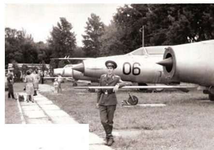
Jaunībā, dienot gaisa spēkos

rainu atlidoja 1992. gadā, kur mēs ar viņu satikāmies. Viņš atlidoja ar ASV gaisa spēku iznīcinātāju F-15. Tad jau PSRS bija sabrukusi, un mēs jau bijām sākuši sazināties ar NATO. Tā bija iespēja pirmo reizi redzēt ārzemju tehniku. Tagad ir tehnoloģijas, ar kurām var testēt jaunās lidmašīnas,