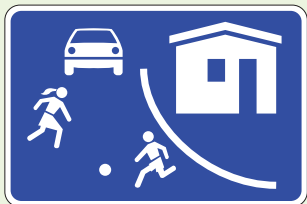
Nr. 528 "Dzīvojamā zona"

• Dzīvojamā zona, kurā iebraukšana apzīmēta ar 528. ceļa zīmi, bet izbraukšana — ar 529. ceļa zīmi.