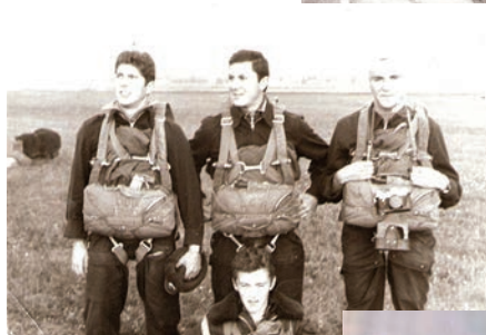
Jaunībā, mācību laikā

Ļoti. Varbūt arī nebūtu iemīļējis lidošanu, ja vien pašā sākumā nebūtu ieraudzījis tieši iznīcinātājus. Ins-