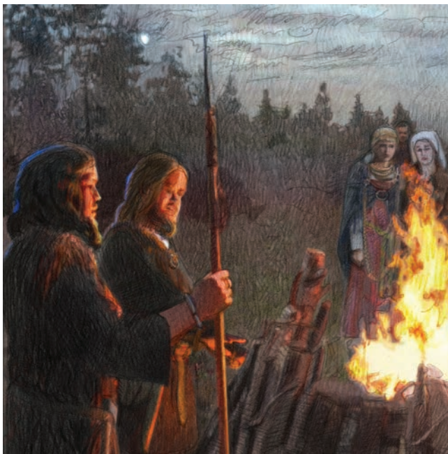
Fragmentis no mākslinieka J.Nikifa zīmējuma grāmatai par Ādažu vēsturi.

Ādažu Kadagas ezers patiesībā ir Kadiķa ezers, tā nosaukums cēlies no austrumlībiešu vārda kadāg – ‘kadiķis’. Lilastes ezera un upes nosaukums ir cēlies no lībiešu li-