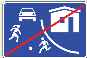
Nr. 529 "Dzīvojamās zonas beigas"