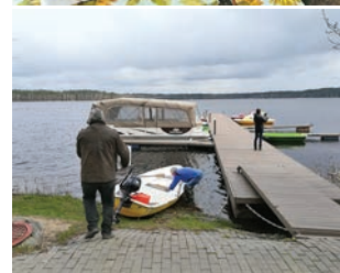
Lapu sagatavoja Saimniecības un infrastruktūras daļa