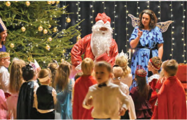
▲ Ādažu pirmsskolas izglītības iestādē bērni ar audzinātājiem kopā uzveduši un spēlēja izrādi "Ziemassvētki ledus pilī".

▲ Ieklausoties dabas skaņās, ieskatoties brīnumsvēciņu liesmās un izbaudot meža burvību, Kadagas pirmsskolas izglītības iestāde Ziemassvētku brīnumu sagaidīja neparastā vidē – mežā.