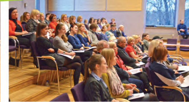
▲ Uzņēmēju diena Ādažos pulcē topošos, jaunus un jau pieredzējušos uzņēmējus!