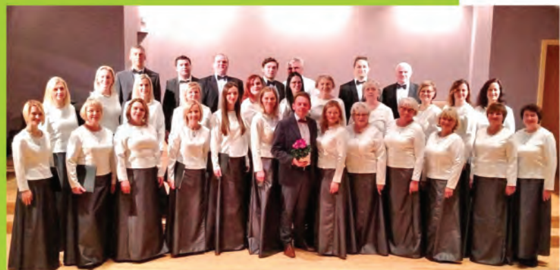
▲ Jauktais koris "Jumis" sadraudzības koncertā "Tikšanās vēlā rudenī".

▲ Ieklausoties dabas skaņās, ieskatoties brīnumsvēciņu liesmās un izbaudot meža burvību, Kadagas pirmsskolas izglītības iestāde Ziemassvētku brīnumu sagaidīja neparastā vidē – mežā.