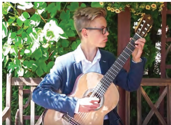
Izpidot skaņdarbu "El Negro".

Jātrenējas vēl cītīgāk, jo tagad skrienu nedaudz lēnāk, bet nekas nav neiespējams! Viņiem rezultāti ir nedaudz augstāki, bet es ceru, ka drīz varēšu viņus noskriet!