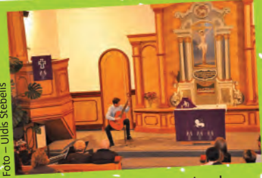
▲ Ādažu Mākslas un mūzikas skolas audzēkņi uzstājas Garkalnes baznīcā, iepriecinot klausītājus ar emocionāliem priekšnesumiem!