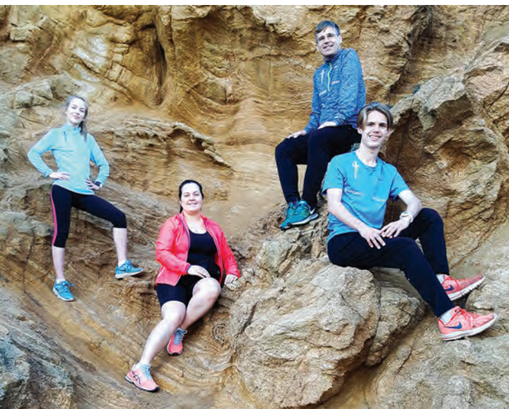
Ģimenes kopbilde treniņnometnē Spānijā.

jomām, vai nu sportu, vai mūziku, bet mani patiešām interesē abas šīs jomas. Rīgas Valsts 3. ģimnāzijā esmu izvēlējis mācīties mākslas modulī. Tas nozīmē, ka nedēļā papildu apgūstu arī mākslas priekšmetus – zīmēšanu, kompozīciju un mākslas vēsturi, kurā mēs mācāmies, kādi bija mākslas stili dažādos laikos, kā tie aizsākās. Ļoti interesanti. Šobrīd vairāk sanāk koncentrēties skriešanai, mūziku esmu mazliet nolīcis malā.