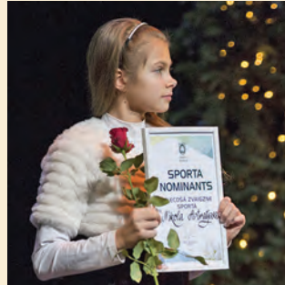
Nikola Astratjeva – uzlecošā zvaigzne sportā