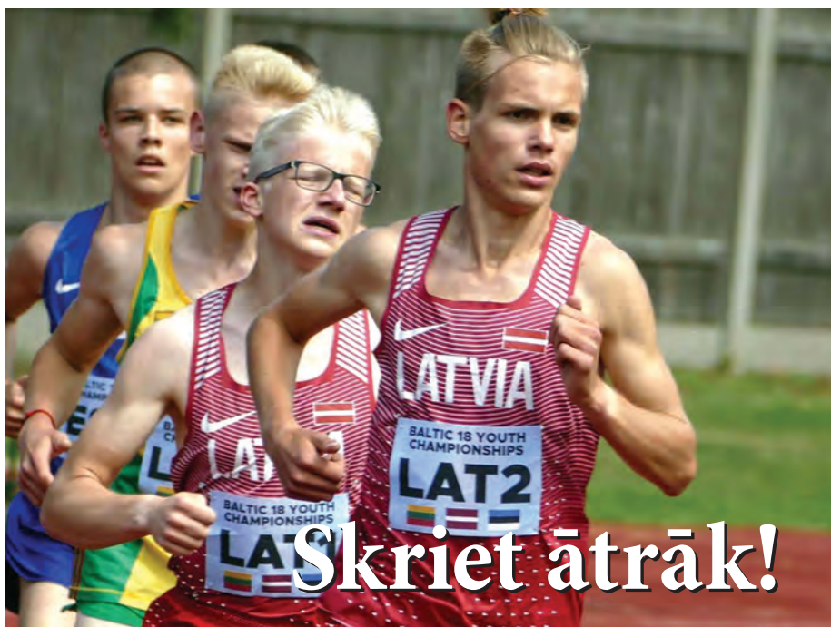
Baltijas čempionāts, 3000m skrējieni, Valmiera.