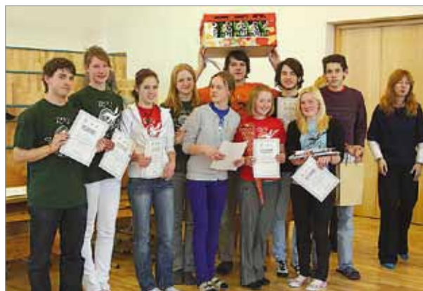
Gandarījums par piedalīšanos