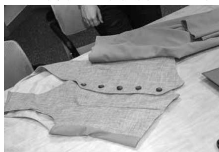
▲ „Ādažu jauniešu deju kolektīvs” – projekts „Ādažu jauniešu deju kolektīva puišu skatuves tērpu šūšana”