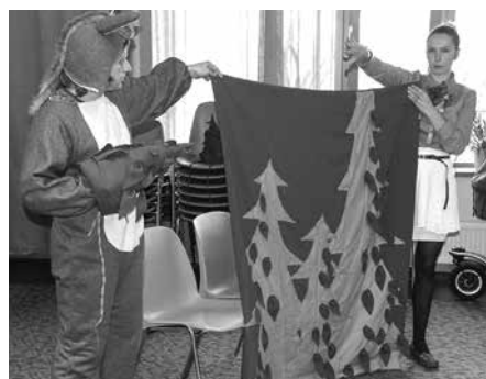
▲ „Kontakts @ Mundus” – projekts „Jauniešu kora „Mundus” un amatierteātra „Kontakts” kopprojekts materiālās bāzes nodrošināšanā mūziklam „Brēmenes muzikanti”

Izvērtējot visus projektu iesniegumus pavasarī, konkursa žūrijas locekļi skatījās, lai projekti atbilstu konkursa galvenajai būtībai – lai iedzīvotāji var izstrādāt un īstenot projektus, kas dod iespēju iedzīvotāju grupām pašu spēkiem uzlabot savu dzīvi un dzīves kvalitāti. Apmeklējot atbalstītās pro-