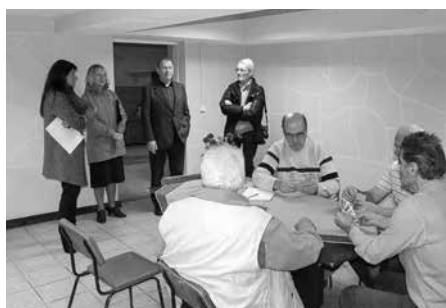
▲ Biedrība „Optimists” – projekts „Nodarbību telpas ierīkošana pensionāriem, 1.kārta”

Neatkarīgi no projektu darbības jomas to īstenošanai tika atvēlēts salīdzinoši neliels laika posms – tie bija jābeidz līdz septembra vidum, taču, kā pārliecinājās konkursa žūrija apmeklējuma laikā projektu īstenošanas vietās, gandrīz visas grupas spēja iekļauties noteiktajā laikā un sasniegt projektu pietiekamos izvirzītos mērķus. Konkursa ietvaros tika īstenoti šādi projekti: