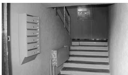
▲ „Kaimiņienes apvienojas” – projekts „Jumts virs galvas”