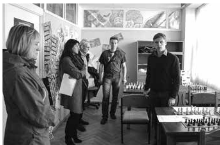
▲ Iedzīvotāju grupa „Asini prātu” – projekts „F.Circeņa šaha kluba izveide”