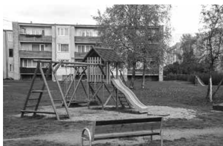
▲ „Entuziasti” – projekts „Bērnu rotaļu laukuma labiekārtošana”