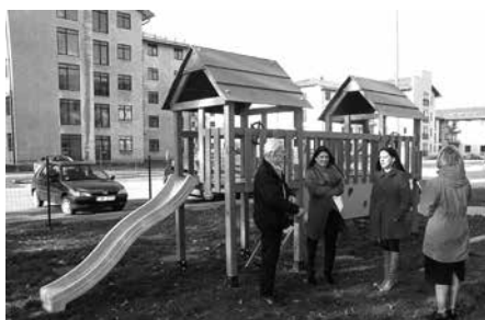
▲ „Vecāki – bērniem” – projekts „Bērnu priekam un veselībai”