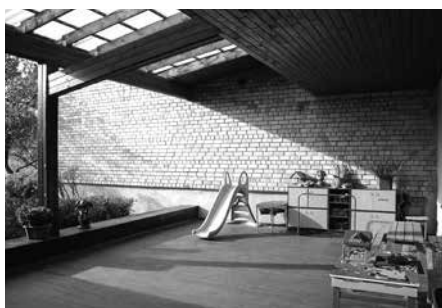
▲ „Sapņotājas” – projekts „Mili savu māju”