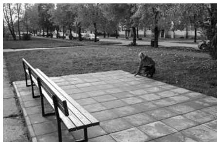
▲ Biedrība „Dzīvesspēks” – projekts „Atpūta piesaulē”