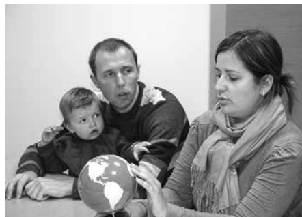
▲ „Podnieku misija” – projekts „Varoņu brīvdienu – atklājot Visumu”