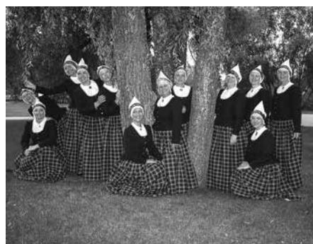
▲ Iedzīvotāju grupa „Jautrie dejotāji” – projekts „Vidzemes dejas”