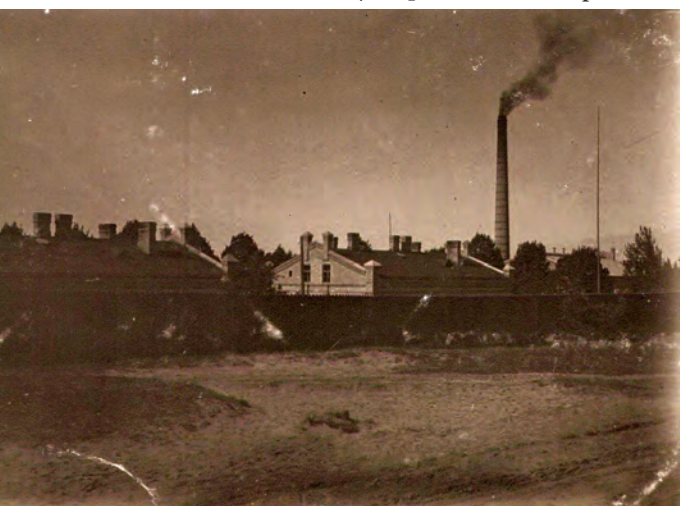
Sūkņu stacija pirms 1. Pasaules kara

Labāka dzeramā ūdens meklējumos Rīgas pilsētai apmēram pirms 130 gadiem (1883. gadā) no Vācijas tika ataicināta grupa hidroģeologu. Augstas raudzes inženieri vārda tiešā nozīmē metru pa metram izurba Bukultu, Rembergu un Zaķumuižas pazemes dzīles un izpētīja tur esošo pazemes ūdeņu slāni. Rezultāti izrādījās pārsteidzoši.