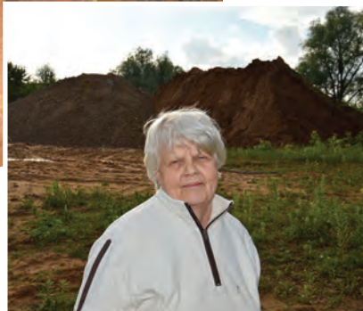
Janas tante nesavtīgi rūpējas par mazajām dvēselēm

tāds lēmums. Vispirms uzstādījām vienu mājiņu, pēc nedēļas – otru. Tā kā kaķi bija sadalījušies grupās, bija skaidrs, ka visi vienā mājā nesa dzīvos, tieši tādēļ vajadzēja domāt arī par otru. Materiālus mājiņu izveidei vajadzēja pirkt pavisam minimāli, jo