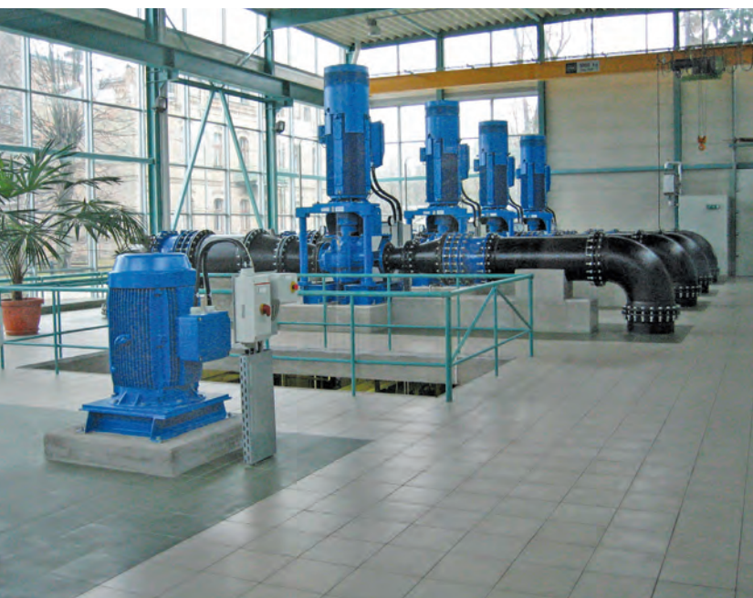
Jaunuzceltā sūkņu telpa 2002. gada jūnijs