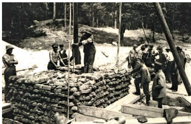
Filtraku izbūve 20.–30.gadi