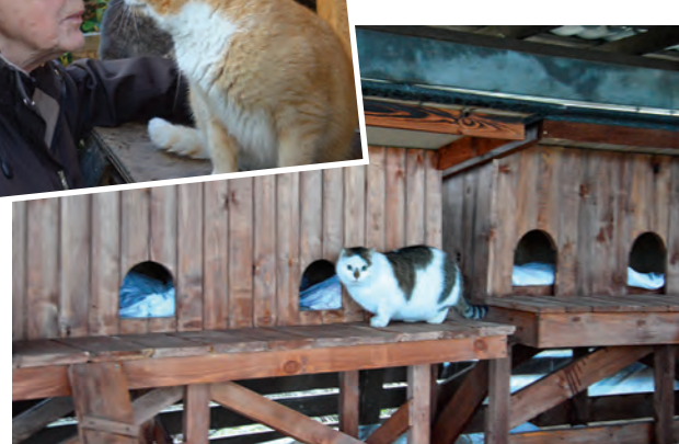
Arkādija veidotās kaķu mājas