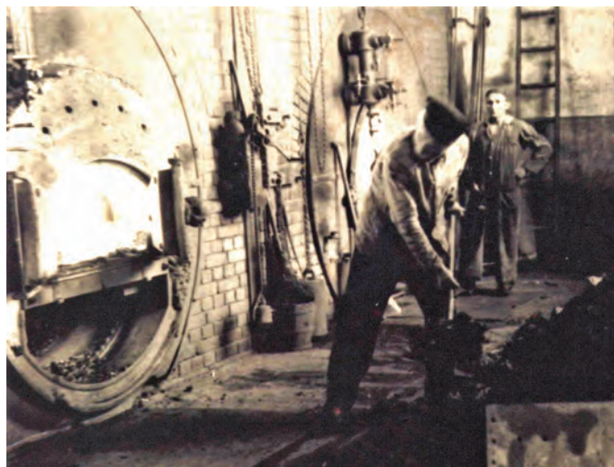
Strādnieku darbs pie akmeņogļu krāsnīm 20.–30.gadi