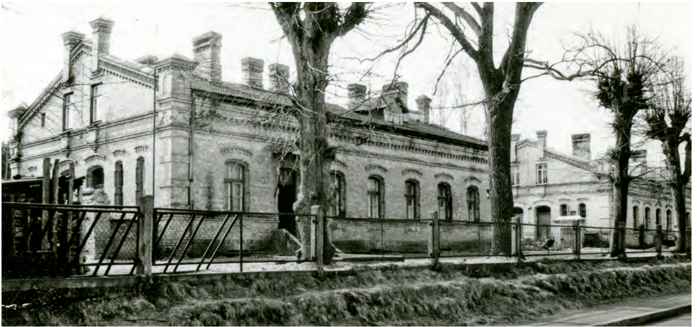
Sūkņu stacijas ēkas. 1995. gads

sētās un viņas rokām aprūpētās milzu palmas. Botāniskā dārza cienīgi eksemplāri. Mūsu platuma grādos – absolūti neiespējami noticēt! Aizbrauciet un pargaugieties paši savām acīm.