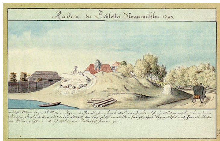
Bukultu Pilsdrupas, 1798. g. J. K. Broce