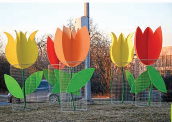
▲ Neparasti lielas un skaistas tulpes šogad svētku laikā uzdziedējušas Ādažos.