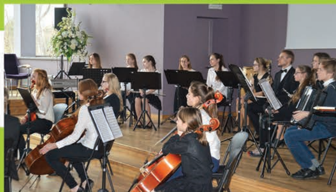
▼ Jauno komponistu konkursā "Skaņuraksti Ādažos" klausītājus priecē Ādažu Mākslas un mūzikas skolas orķestris.