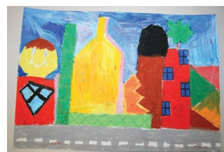
Karlīna Artemenkova (3 gadi)