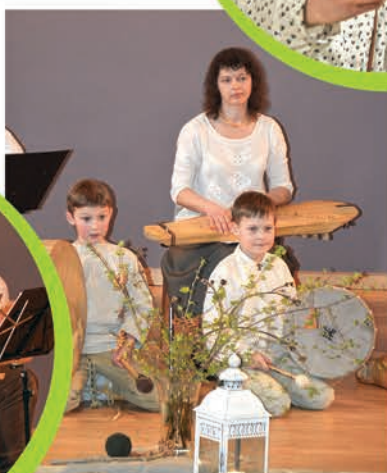
▼► Lieldienas ieskandina Rīgas Kultūras un mākslas centra "Ritums" folkloras kopa "Laiva" un Ādažu folkloras kopa.