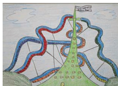
Rainers Līcis Līcītis