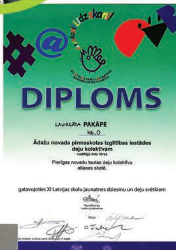
◀ Gatavojoties XI Latvijas skolu jaunatnes dziesmu un deju svētkiem, Pierīgas novadu tautas deju kolektīvu atlasēskatē Ādažu pirmsskolas izglītības iestādes deju kolektīvs ieguvis laureāta pakāpi.