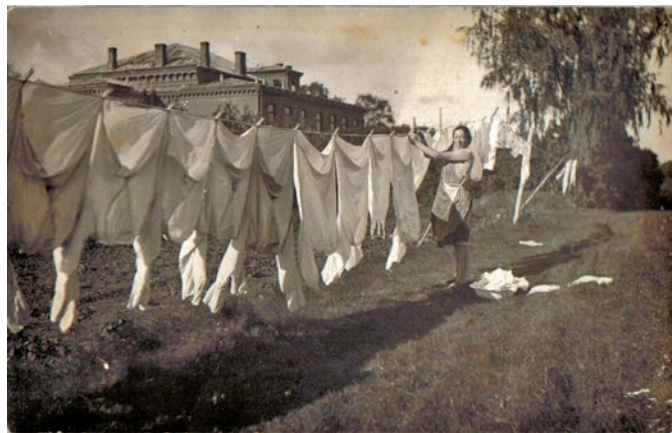
Tautas nams, 1927. gads

Kāpēc, runājot par Ādažiem, tiek pieminētas tieši šīs 12 muižas? Atbilde slēp-