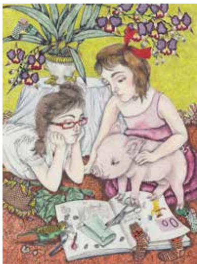
Pasakas ilustrācija: Anna Afanasjeva